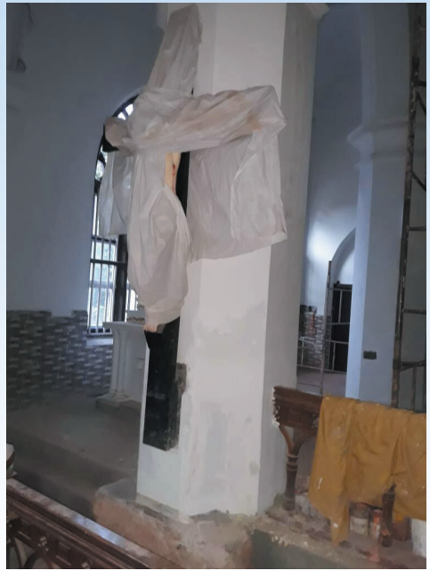
അറത്തുമാറ്റിയ ക്രൂശിതരുപം തൂണിൽ

ഇടവകക്കാർ പോലീസിനും ജില്ലാ കളക്ടർക്കും പരാതി നൽകി. RDO ഇടപെട്ട് ചർച്ച നടത്തി. ഇടവകക്കാരുടെ ആവശ്യം ന്യായമാണെന്നും നിലപാട് മാറ്റണമെന്നും ബിഷപ്പിനോട് ആർ.ഡി.ഒ. ആവശ്യപ്പെട്ടെങ്കിലും അയാൾ വഴങ്ങിയില്ല. സംഘർഷാവസ്ഥ നിലനിൽക്കുന്നതിനാൽ RDO പള്ളി പൂട്ടി, പണി തടഞ്ഞു. തുടർന്ന് ചേരി തിരിഞ്ഞുള്ള തർക്കവും സംഘർഷവും ഇപ്പോഴും തുടരുകയാണ്.