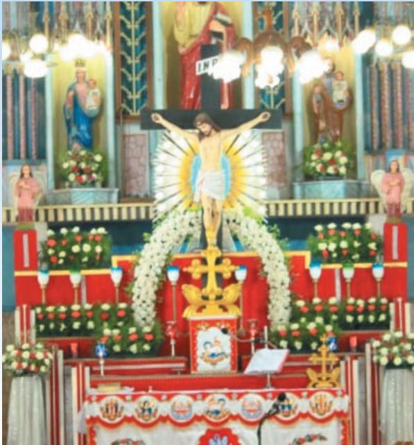
ക്രൂശിതരുപം പിഴുതുമാറ്റുന്നതിനു മുമ്പുള്ള മദ്ബഹ