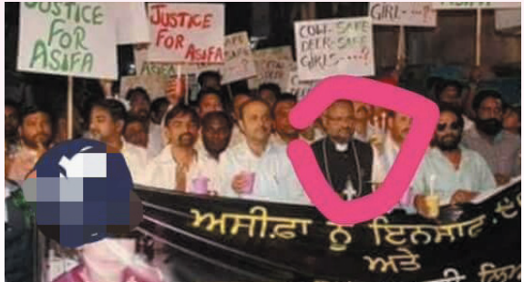
കാൾമീരിൽ നടന്ന ബാലികാലൈംഗികപീഡനത്തിനെതിരെ പ്രകടനംനയിക്കുന്ന ബിഷപ്പ് ഫ്രാങ്കോ മുളയ്ക്കൽ

- ഒരു കന്യാസ്ത്രീക്കെതിരെ സർക്കുലറും ഇടയലേഖനവുമൊക്കെയിറക്കാൻ ഏതു മെത്രാനും സാധിക്കും. അവരുൾപ്പെട്ട സന്യാസസമൂഹത്തെക്കൊണ്ട് കന്യാസ്ത്രീക്കെതിരെ പത്രക്കുറിപ്പിറക്കിക്കാനും മെത്രാനുകഴിയും. എന്നാൽ അതിനൊന്നും കഴിയാത്തവർക്കെതിരെ, അധികാരത്തിന്റെ തണലിലിരുന്ന് 'ആധികാരിക'മായി ആരോപണങ്ങളുണ്ടാക്കുന്നതിലും കുറ്റം വിധിക്കുന്നതിലുമുള്ള അധർമ്മീകരണവും വ്യക്തിഹത്യലക്ഷ്യവും