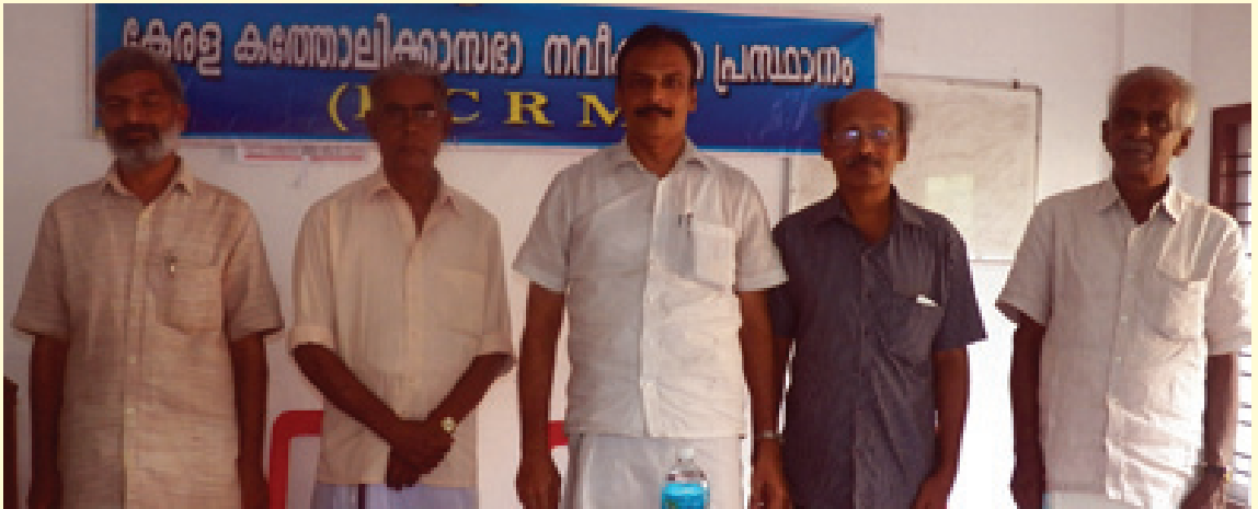
പുതിയ ഭാരവാഹികൾ മുൻ പ്രസിഡന്റിന്റെ കൂടെ.

KCRM നേരത്തേതന്നെ പ്രസിദ്ധീകരിച്ചിട്ടുള്ള നയപരിപാടികൾ വിശദമായി ചർച്ചചെയ്ത്, KCRM -നെ ശക്തിപ്പെടുത്താനും കൂടുതൽ വ്യക്തമായ ദിശാബോധം നൽകാനും താൻ ആഗ്രഹിക്കുന്നുവെന്ന് പുതിയ പ്രസിഡന്റ് വ്യക്തമാക്കി.